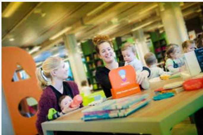
Kom naar het BoekStartfeest van Theek 5

Tijdens Baby-yoga en massage gaan we op een speelse manier aan de slag met duo yogahoudingen, massage (over kleding heen), versjes en liedjes die op verschillende vlakken goed en leuk zijn voor de baby en jou! Baby-yoga is een speciale vorm van yoga, die is aangepast voor baby's en hun verzorgers. Het ondersteunt de lichamelijke, emotionele en mentale ontwikkeling van baby's en versterkt de band tussen baby en ouder.