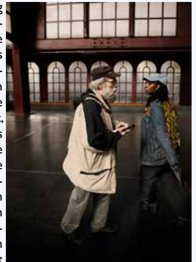
Antwerpen Centraal Station

Tijdens de fotobespreking van de in Antwerpen gemaakte foto's zijn diverse onderwerpen en locaties op het grote scherm gepresenteerd. Veel leden gaven aan dat eigenlijk alle foto's die daar zijn gemaakt, heel erg mooi zijn. Het was dus moeilijk kiezen welke foto de titel "Foto van de Maand" gaat krijgen. Gelukkig hebben veel leden hun stem uitgebracht en gezamenlijk zijn zij dan uitgekomen bij een foto van Marijke de Haze. Proficiat Marijke, met deze overwinning! Het betreft een