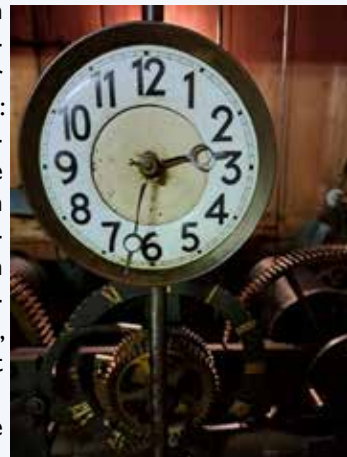
Detail uit de mechaniekkamer van het uurwerk van de Antonius Abt

P.S. Vanaf juni is de Antonius Abt iedere zaterdagmiddag gratis te bezoeken. Iedere eerste zaterdag van de maand bieden we met onze vrijwilligers ook het toren beklimmen aan. U kunt dan zelf bij het uurwerk komen kijken en meer horen over hoe het allemaal werkt.