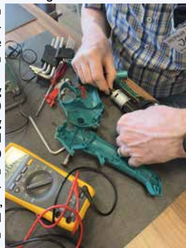
We repareren van alles, ook elektrische snoeimessen.

We zijn op woensdag 29 mei weer van 13.00 tot 16.00 uur aanwezig bij SOVAK, Koningsveld 1 in Terheijden. Na 15.30 uur kunnen we helaas geen nieuwe reparaties meer aannemen. Reparaties zijn gratis, maar omdat wij financieel volledig afhankelijk zijn van donaties, wordt een vrijwillige bijdrage gewaardeerd.