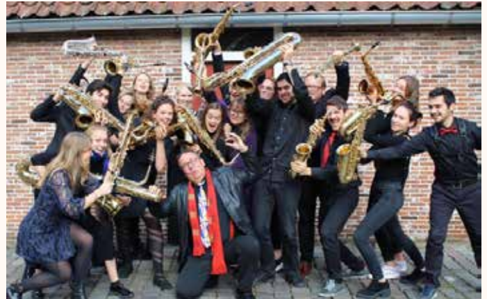
AHSO, ArtEZ/HKU Saxophone Ensemble

We beginnen onze 48-ste serie a.s. zondag 17 september met een Theeconcert met het Olga Vocaal Ensemble, daarna volgt het Amateurconcert en nog 5 Theeconcerten.