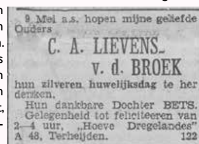
Uit: Dagblad van Noord-Brabant 24 - 4 - 1937