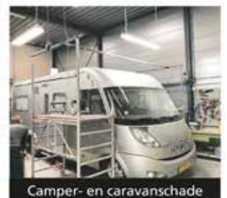
Camper- en caravanschade