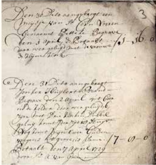
Begraafboek uit 1729