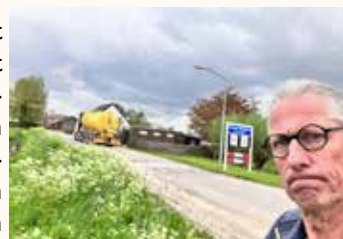
Vrachtwagen in Hooge Zwaluwe

Er is al veel gepraat over dit onderwerp. In 2018 kwam het idee om een omleiding te maken om de Zoutendijk heen naar de Zonzeelseweg. De huizen aan de Zoutendijk zouden dan gespaard worden. Dit plan werd niet uitgevoerd. Alternatief was een andere omleidingsroute, via de Ruilverkavelingsweg naar de Zanddijk in Made. Deze wegen werden goed aangepakt en geschikt gemaakt voor zwaar en meer verkeer.