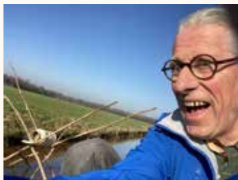
Buiten onze gemeente: een eendenbroedmand

SAMEN Drimmelen zou ook wel een beleid voor dieren willen hebben in de gemeente Drimmelen. Laat zien dat je de naam blauwgroene gemeente met trots kunt dragen en zet je in voor