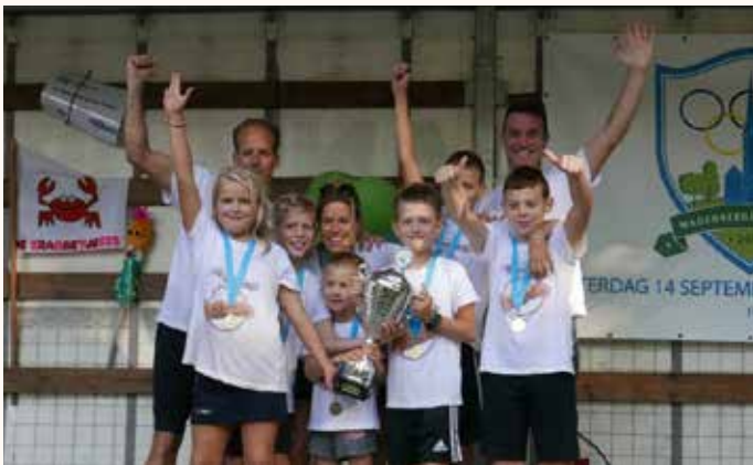
De winnaars van de vorige editie in 2019, de Frikandellenbroodjes.

Een heus feestje voor alle leeftijden dus.