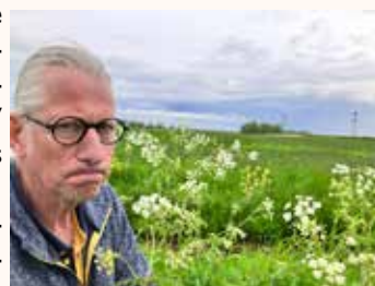
De plaats van de bypass

Na de verkiezingen schreef de coalitie in haar plan dat de bypass er moest komen. Het proces is weer in gang gezet. Op 17 mei werd in het gemeentehuis verdere informatie gegeven.