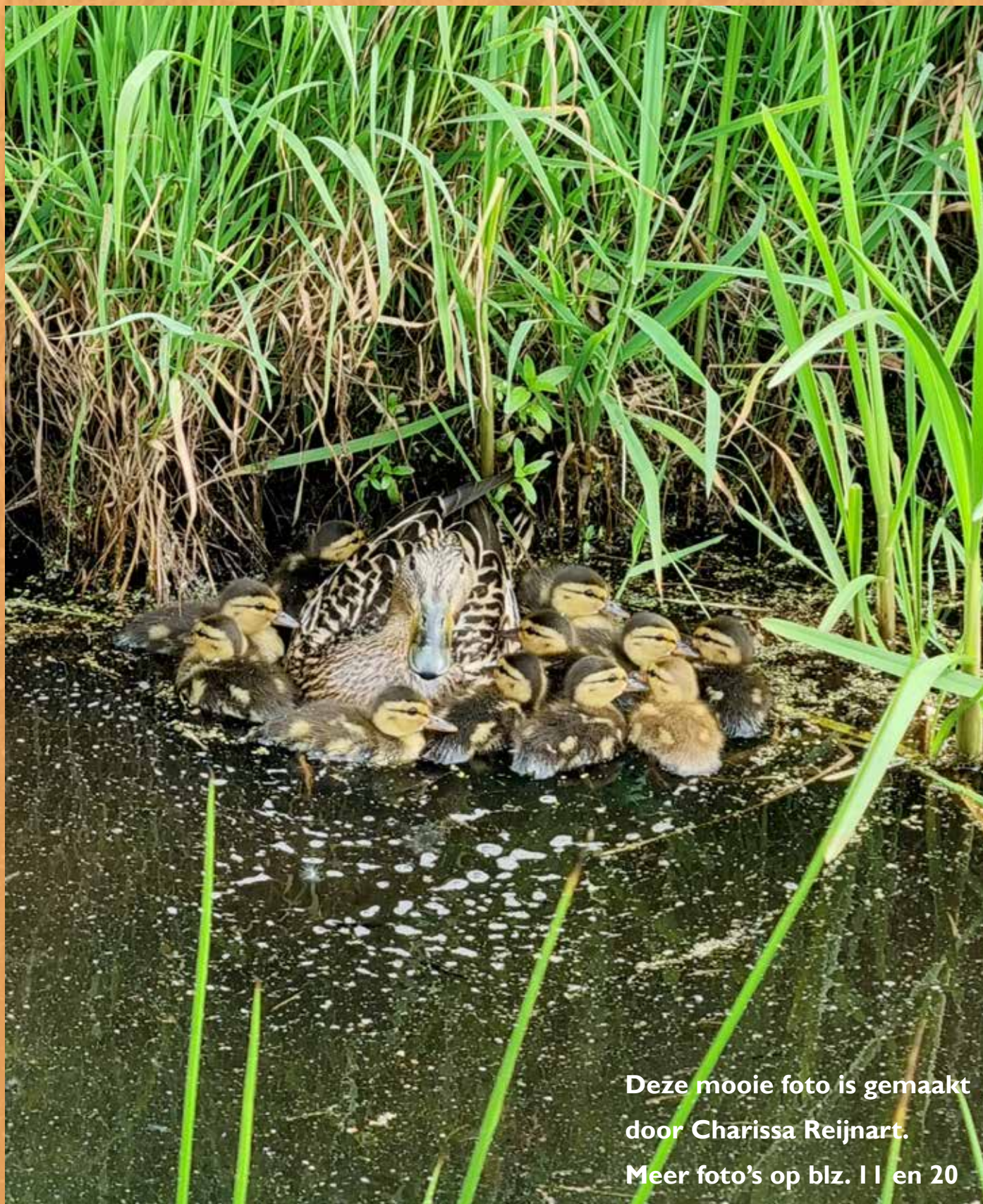
Meer foto's op blz. 11 en 20