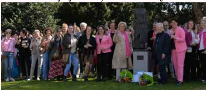
Boven- en onderstaande foto maakte Gerard van Vugt op de Saradag in Made.