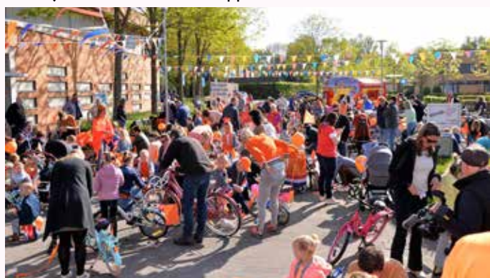
Koningsdag 2022 Terheijden.

Terheijden, Ravensnest 5: Kappen van een beuk.