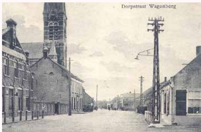
De eerste straatverlichting op electriciteit

De gemeente wordt reeds elektrisch verlicht. Het raadhuis is