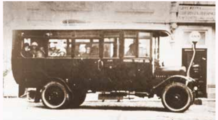
Autobus Schets & Van Bekhoven, Raadhuisstr. 69-71

Voor de waterleiding voelen de mensen blijkbaar niet veel; er zijn nog slechts 50 aansluitingen. Men kon nu de brandweer reorganiseren en schafte zowel voor Wagenberg als voor Terheijden elk drie standpijpen met bijbehorende slangenwagen aan.