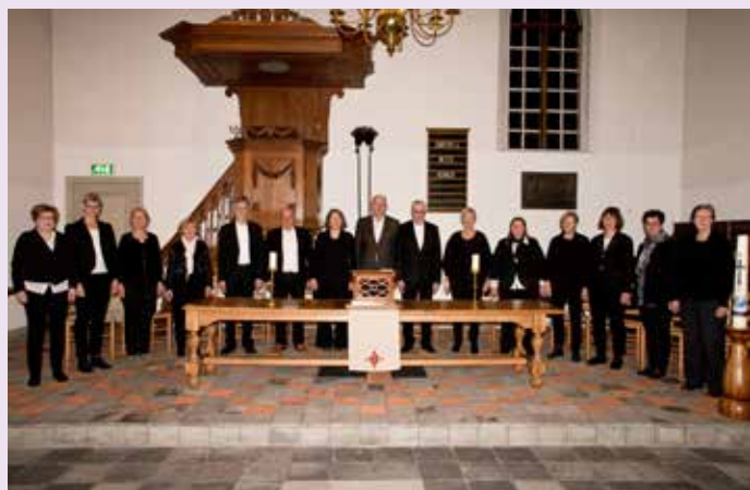
Cantorij Protestantse Gemeente Terheijden-Wagenberg