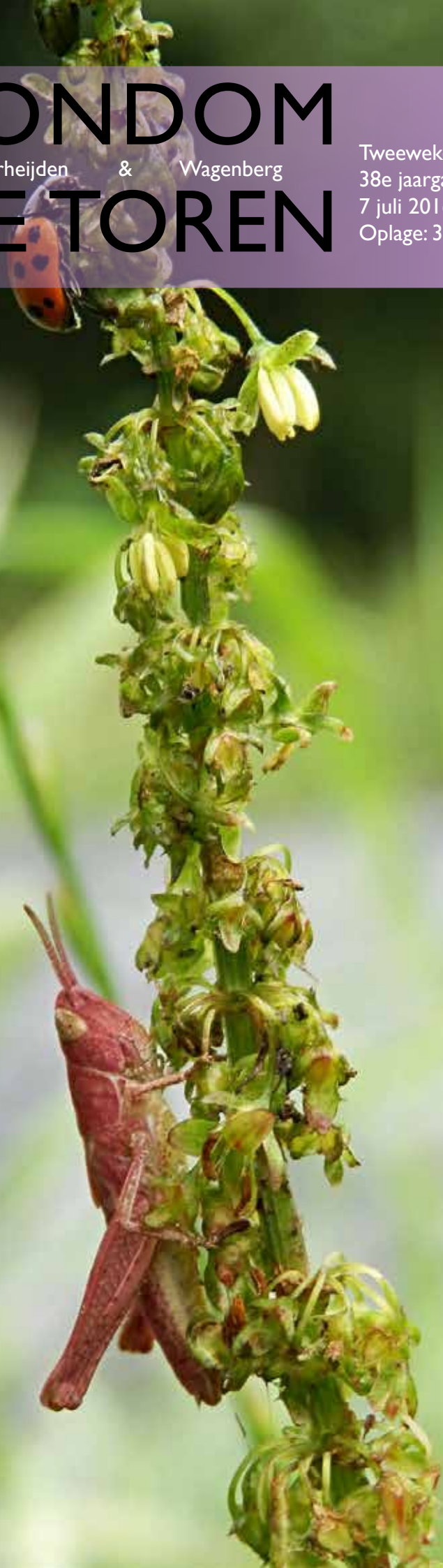
Een roze sprinkhaan (waarschijnlijk pigmentafwijking)

Tweewekelijks informatieblad 38e jaargang nr. 949 7 juli 2016 Oplage: 3650 stuks.