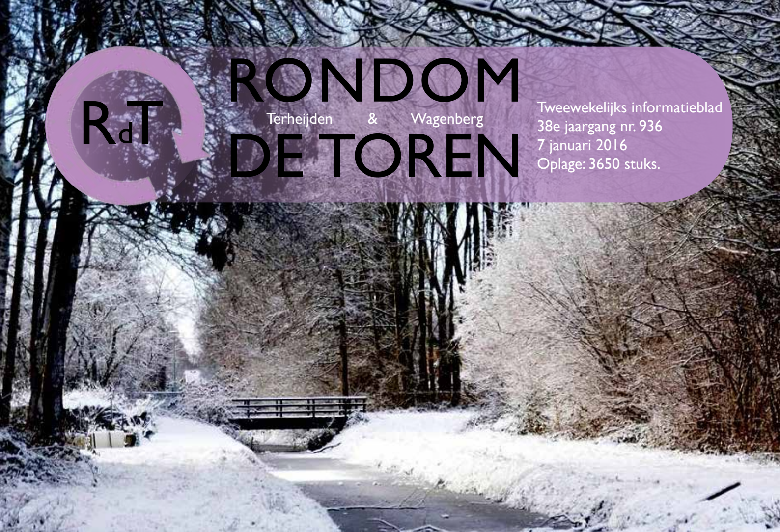
Boven: Begin 2015..... Onder: Begin 2016.....

Tweewekelijks informatieblad 38e jaargang nr. 936 7 januari 2016 Oplage: 3650 stuks.