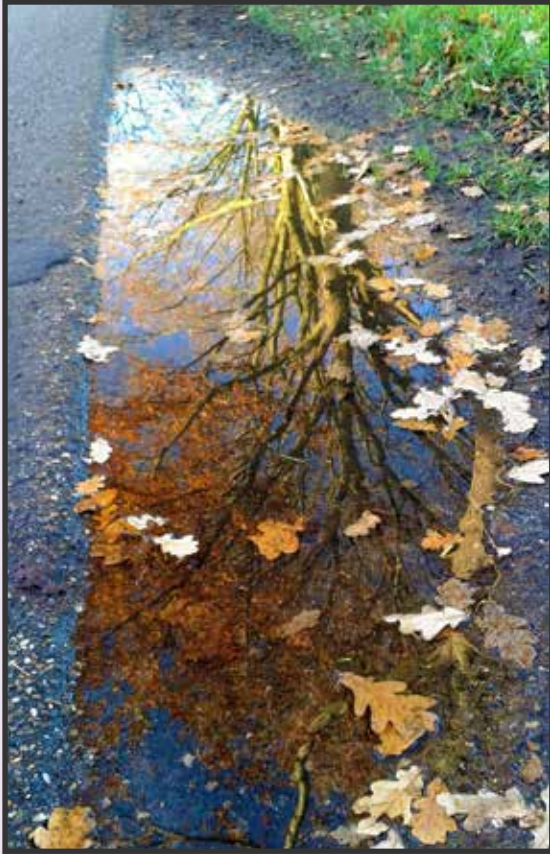
Leny Peemen: Ook in een plas water is de natuur prachtig.....