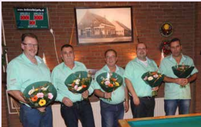
't Sluisje, de winnaars van het triatlon van bv de Vriendschap uit Wagenberg.

't Sluisje schrokken hier niet van en na 10 wedstrijden was de achterstand omgedraaid in een voorsprong van 6-14. Daarna probeerde 't Hartje er nog van alles aan te doen maar moest uiteindelijk de overwinning en de titel aan 't Sluisje laten, uitslag 12-18. Goede partijen werden gespeeld: Bij het 3 banden door Ralph de Roon van 't Sluisje met een moyenne van 3.00, bij het bandstoten door Jan de Craen van Keus Genoeg met een moyenne van 3.50, bij het libre door Piet de Graaf van KBO met een moyenne van 3.50.