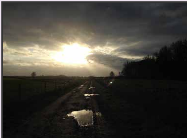
Anica Embregts: zandpad langs de Wagenbergse Baan