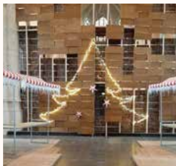
Opbouw van de kerstmarkt tijdens een eerdere editie

Wist u dat de opbrengst van de kerstmarkt naar het behoud van de Antonius Abt gaat? Stichting Behoud de Antonius Abt organiseert jaarlijks met haar vrijwilligers deze kerstmarkt voor en door Terheijden om geld in te zamelen voor het behoud van het monumentale gebouw de Antonius Abt. De opbrengst van de kraamverhuur en de horeca tijdens de kerstmarkt komen dan ook volledig ten goede aan dit doel.