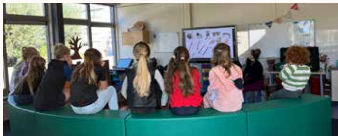
Repetitie muziek in de school

Waar naar toe is nog een verrassing (voor ons ook 😊) maar ook dat volgt later!