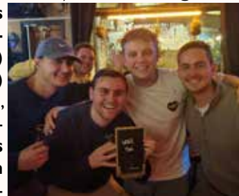
Team Boemer Out

Donderdag 28 november was de tweede Zevende Hemel caféquiz van seizoen 2024-2025. Het was weer, zoals verwacht, lekker vol en er deden deze keer 22 teams mee. De uitslag was als volgt: 1) team Bol.com en team Boemer Out met 56 punten, 2) team Trainingsbeesten I met 54 punten, 3) Ton's Angels en team Trainingsbeesten 2 met 53 punten, 4) team DIOK met 51 punten, 5) team Bubbels met 50 punten, 6) team Team T met 49 punten, 7) team Slappe Trappers met 48 punten, 8) team Van Mij Mag Alles met 47 punten, 9) team Handbal en team The Buitenlanders met 45 punten, 10) team Slappe Trappersss met 44 punten, 11) team