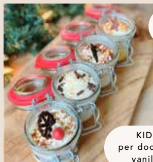
WECKPOTJES €3,25 (+statiegeld €1)