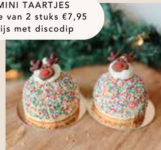
KIDS MINI TAARTJES per doosje van 2 stuks €7,95 vanille ijs met discodip

De ijsdesserts zijn te bestellen via onze webshop www.zuivelijs.nl/webshop of mail naar marja@zuivelijs.nl