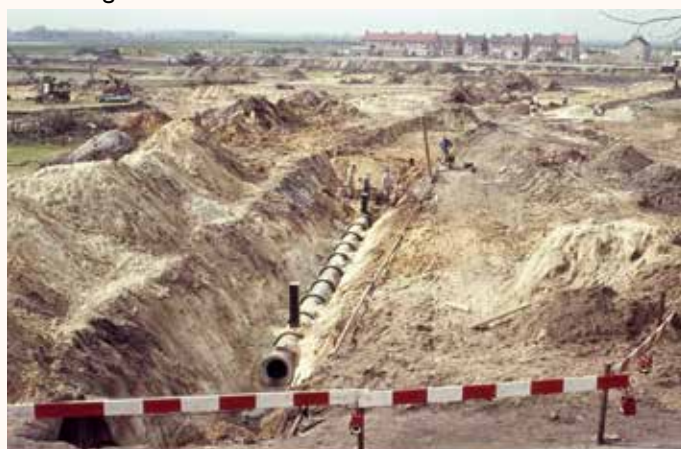
De rand van 't Zand in 1964, nu begin Polderstraat.

Van die oorspronkelijke zandruggen is hier nu weinig of niets meer te zien. Een aannemelijke verklaring hiervoor is dat het overvloedige zand zal zijn afgevlakt voor bewoning. Vanaf ongeveer 1300 zal het gebruikt zijn voor het maken van dijken die hier en westelijk van ons werden aangelegd. Dat was het begin van de afgravingen. Tot aan het begin van de vorige eeuw is nog veel zand afgevoerd vanuit de Bergen en bij het graven van het Markkanaal. Bij het uitgraven van vlieten komt nogal eens oorspronkelijk wit zand naar boven, zoals in 1983 langs de Witteweg en in 2006 tussen de Wildestraat en Scheerbiessstraat.