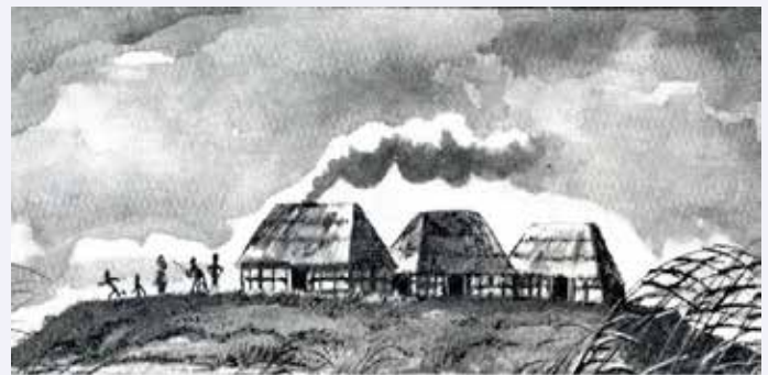
Bewoning op een zandheuvel