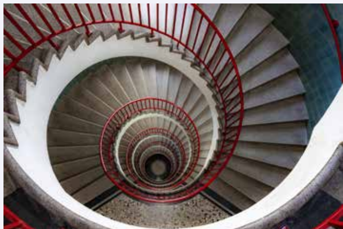
Fotograaf: Peter Moerkens - Trappenhuis in Ljubljana

Van het nieuwe jaar is ondertussen al weer een volle maand verstreken. Tijd dus voor een nieuwe foto van de maand. Van de diverse leden van Fotogroep Perspectief waren er veel foto's die de eretitel in de wacht wilden slepen. Maar uiteindelijk kan er maar één de winnaar zijn. Tijdens de fotobespreking van vorige week dinsdag zijn alle kandidaten voorbij gekomen. En daar zaten werkelijk mooie plaatjes bij.