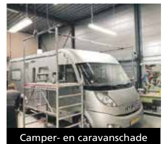
Camper- en caravanschade