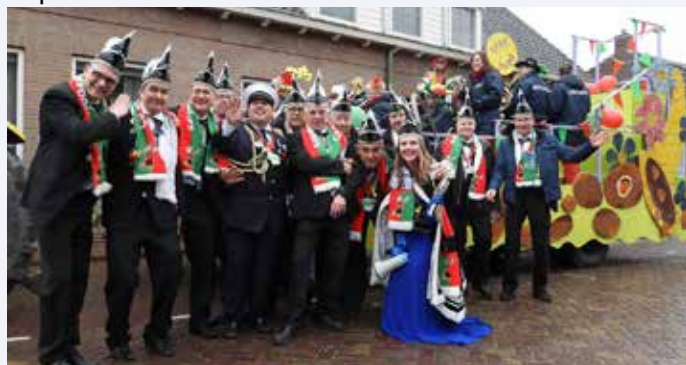
Voor de laatste keer deze Raad van Elf in Erpelrooiersland

1 e Cv de Schuimbrouwers: Wat laote ginne steek vallen, mar help ons deze boerkes tot raad knallen