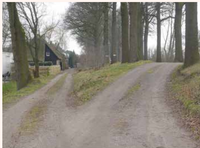
De Helkantsedijk in 2012

De vele dijkwegen in onze omgeving bestaan al heel lang. Zo ook de Moerdijkseweg naar Terheijden en de doorgaande weg in Wagenberg. Na de grote overstromingen in het begin van de 15 e eeuw werd tussen Terheijden en Wagenberg een "Seeijck" aangelegd. Ook de Wagenbergse heuveltjes werden deels afgegraven en verbonden met dijkes. In de Helkant werd de "Sant-