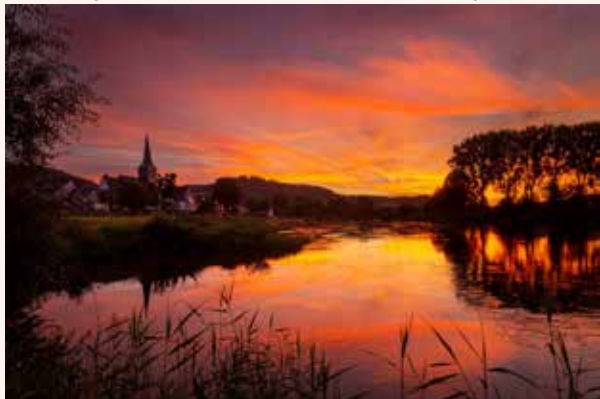
Kees van Gils - Avondrood aan de Weser".

ijverig aan het fotograferen geweest. Zijn er soms opdrachten of thema's waaraan een foto moet voldoen, dit keer hadden de fotografen weer alle vrijheid om hun creativiteit te gebruiken. Ofwel: categorie Vrij Werk was het onderwerp.