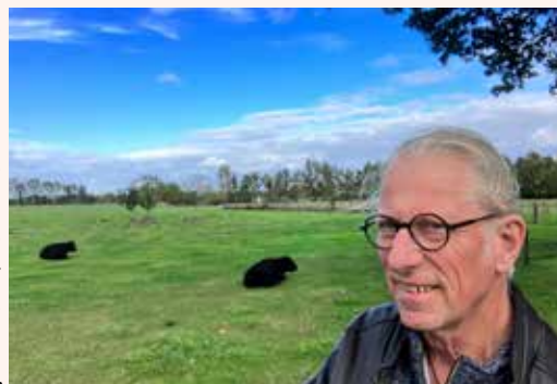
Dieren moeten kunnen rusten in de wei, vindt SAMEN Drimmelen

binnen gaan lopen. De koeien laten zich dan ook melken als ze daar behoefte aan hebben. Een diervriendelijke manier van vleesproducten kweken willen we dus. En als je dan de bovengenoemde aanvragen ziet dan zie je weer die honderden varkens hutje mutje bij elkaar. Of je ziet duizenden kleine kuikens -vleeskuikens, het woord alleen al die in hun korte levenstijd weinig levensvreugde kennen. Haantjes worden direct bij de geboorte al gedood! Ik word er koud van.