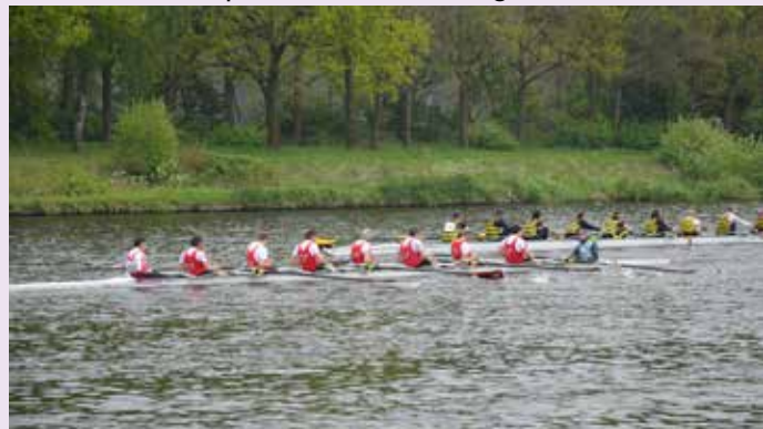
Spannende strijd Bredase roeiers (voorgrond) in Brabant8 Tweekamp.

Met vier teams was Roeivereniging Breda goed vertegenwoordigd bij de Brabant8 Tweekamp. Deze roeiwedstrijd vond op 7 mei plaats op de watersportbaan in Hilvarenbeek en was georganiseerd door de Tilburgse Open Roeivereniging (TOR). In een Time Trial over 3,5 kilometer werd eerst de startvolgorde voor de tweekamp bepaald. Ondanks de harde wind en sterke stroming zetten de Bredase ploegen mooie tijden neer in de Time Trial. De board-aan-board race die daarna over 1 kilometer volgde, leverde veel spannende momenten op. Drie Bredase roeiteams kwamen in hun tweekamp als eerste over de eindstreep. Het zag er veelbelovend uit, maar in de overall eindstand behaalden de Bredase teams in hun categorieën helaas niet de eerste plaats. Al met al was de Brabant8 Tweekamp een mooie en vooral spannende krachtmeting.