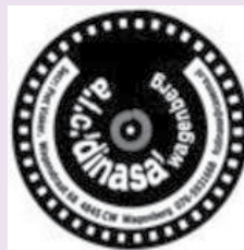
FOTO EXPOSITIE DINASA

Tijdens het Paasweekend, op 16 en 17 april organiseert de Wagenbergse fotoclub Dinasa, die dit jaar 35 jaar bestaat, haar jaarlijkse expositie. Er zijn ongeveer 120 foto's te zien, deze zijn gemaakt door de leden van Dinasa.