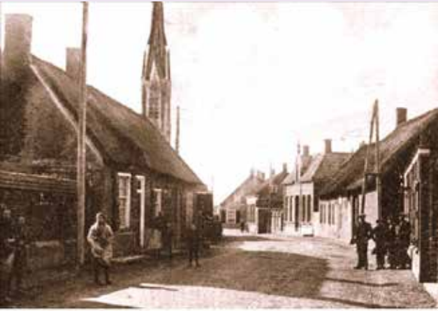
Brouwerijstraat voor en na de brand in 1924