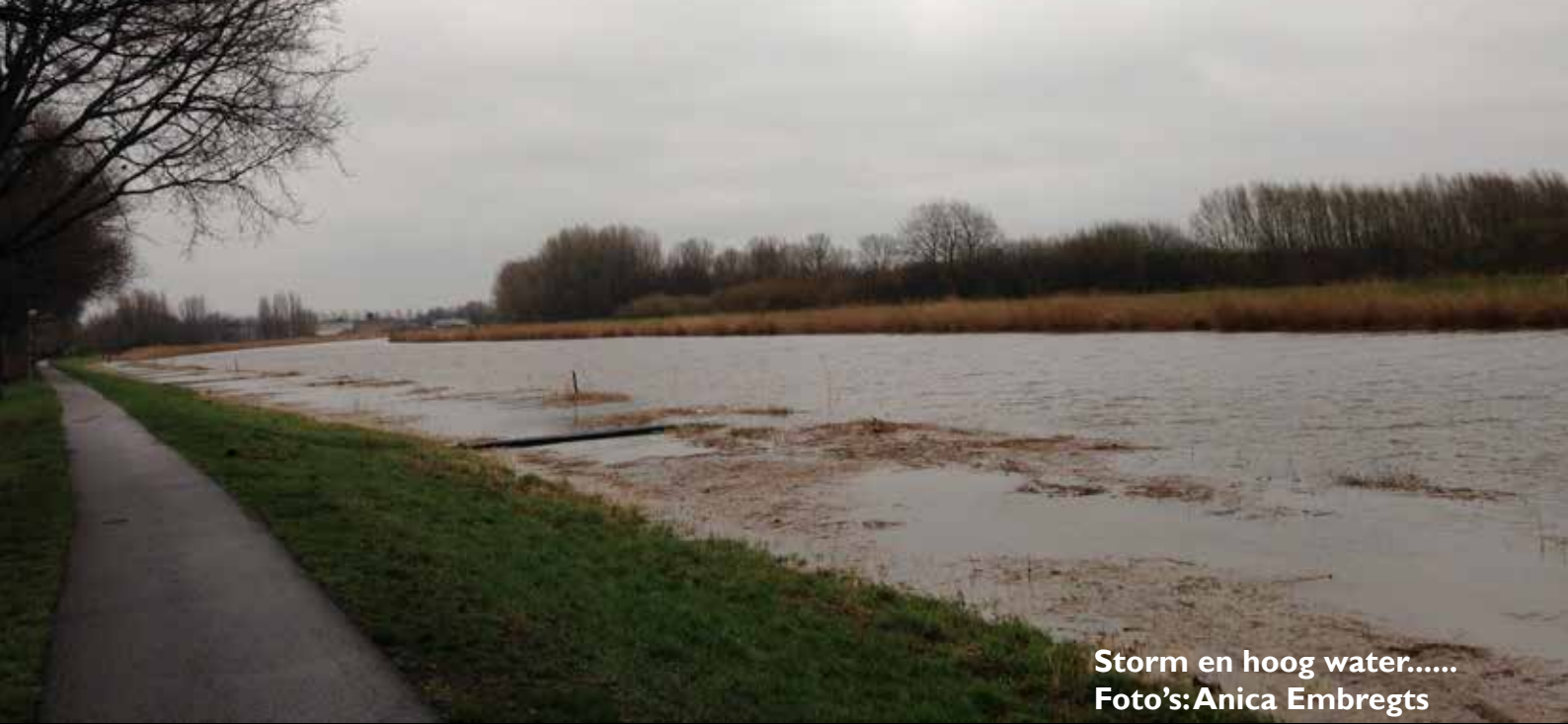
Storm en hoog water.....

Tweewekelijks informatieblad 39e jaargang nr. 963 8 maart 2017 Oplage: 3650 stuks.