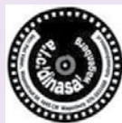
Foto van de maand februari.