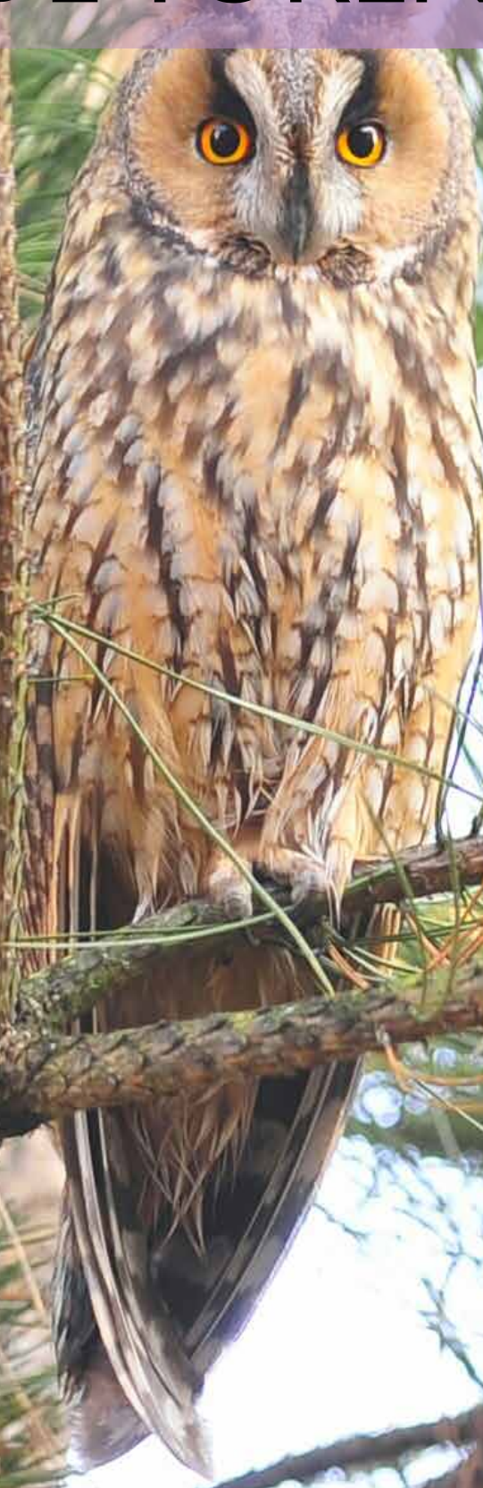
Ransultje in Terheijden

Tweewekelijks informatieblad 39e jaargang nr. 96 | 9 februari 2017 Oplage: 3650 stuks.